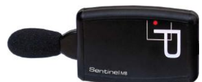
Sonomètre déporté bande d'octave